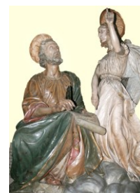
Parrocchia dei Santi Matteo Apostolo e Giovanni Battista - Cannara